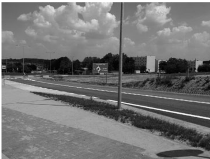
Kolejny odcinek obwodnicy

W naszym mieście w ostatnich tygodniach dobiegły końca prace przy kilku ważnych inwestycjach. Na początku lipca zakończyły się roboty związane z budową kolejnego etapu drogi łączącej ul. Długą z ul. Knosały, a więc obwodnicy zachodniej.