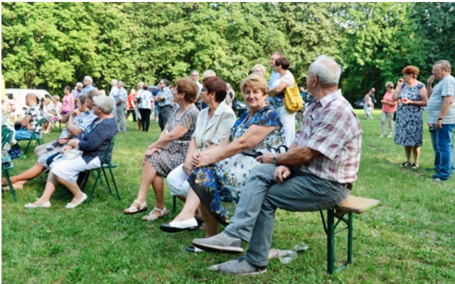
Festyn Rzemieślniczy – Senioralia 2017

Senioralia to impreza, która na stałe wpisała się w kalendarz wydarzeń w Radzionkowie. W tym roku seniorzy będą świętować od 25 do 31 sierpnia. Czekają na nich wiele ciekawych atrakcji.