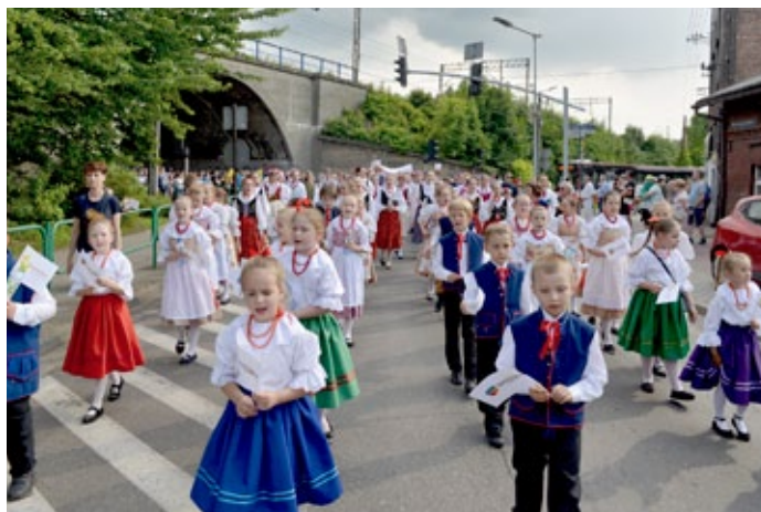
Kulminacyjne obchody dni miasta rozpoczął tradycyjny korowód