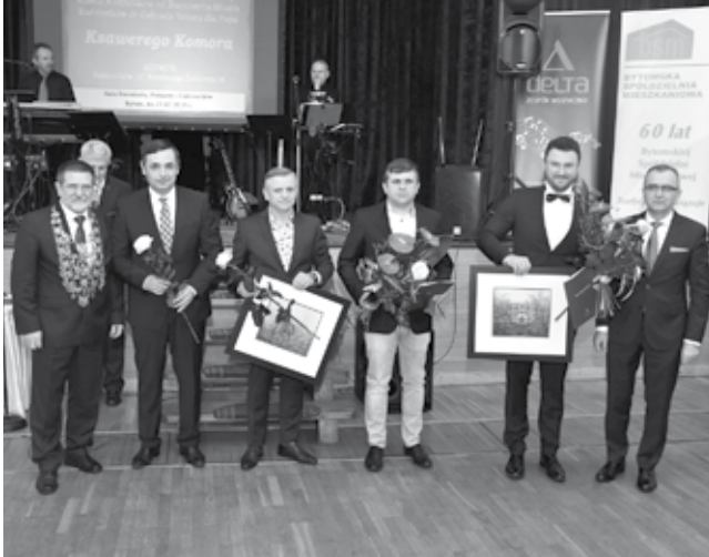
Niektórzy z wyróżnionych radzionkowskich rzemieślników

Uroczystą Mszą św. odprawioną 17 marca w bytomskim kościele Św. Jacka, rozpoczęła się coroczna Gala Rzemiosła Piekarzy i Cukierników. Po jej zakończeniu uczestnicy – na czele z wojskową orkiestrą dętą, starszą cechową, sztandarami i gośćmi udali się do Restauracji „Myśliwska”, gdzie wręczono dyplomy i odznaczenia dla rzemieślników i ich zakładów.