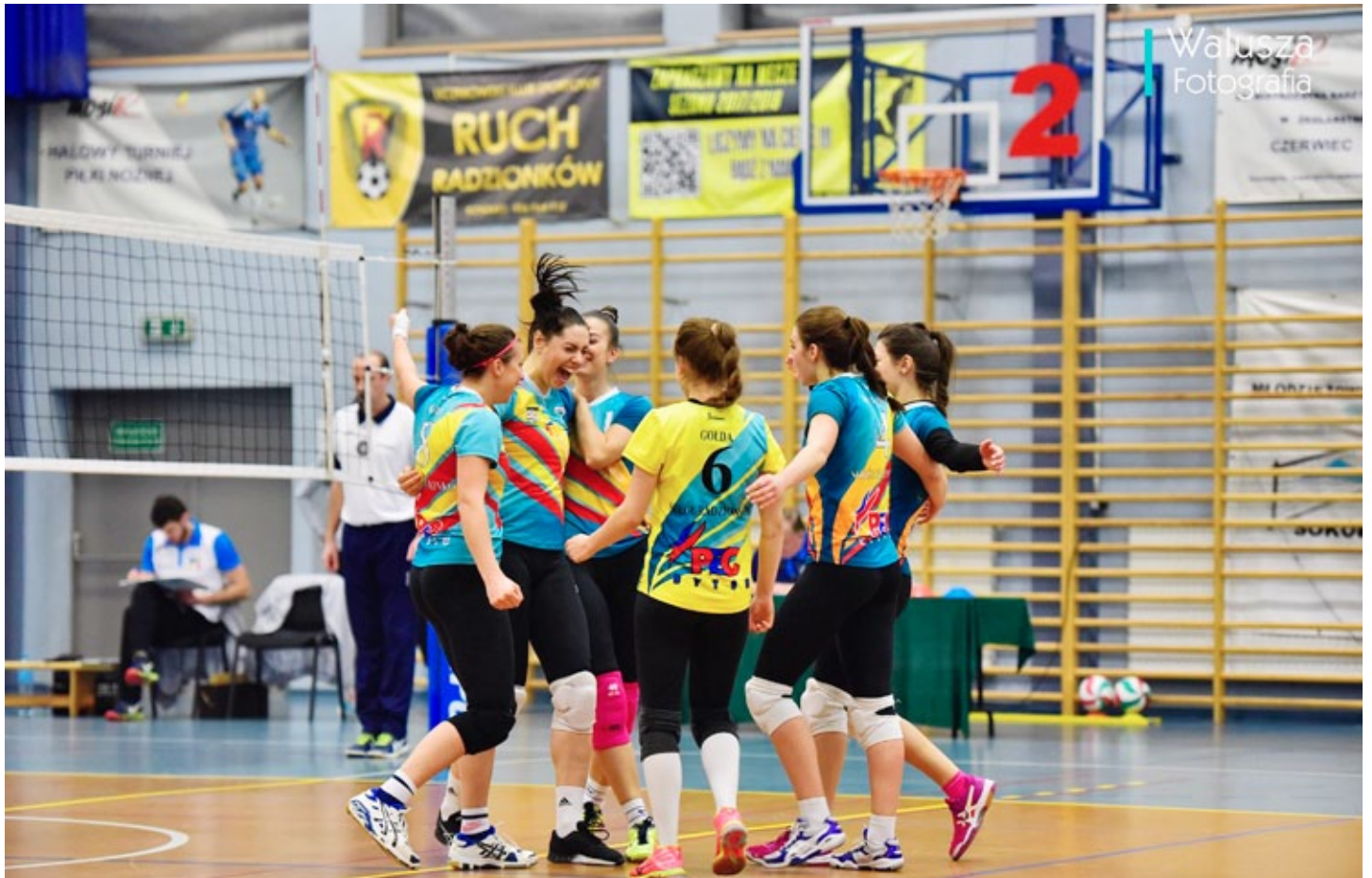
Gra zawodniczek „Sokoła” to gwarancja dużych emocji na boisku i trybunach

Drużyna „Sokoła” Radzionków zajmuje 5. miejsce w tabeli 3. grupy II ligi kobiet Polskiego Związku Piłki Siatkowej. Mimo, że do zakończenia rundy zasadniczej pozostał do rozegrania wyjazdowy mecz we Wrocławiu z tamtejszym Impelem, to na zmianę miejsca na wyższe lub niższe nie należy już liczyć.