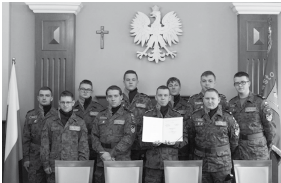
Porozumienie pozwoli radzionkowskiej drużynie nosić umundurowanie Sił Zbrojnych RP

20 lutego zawarte zostało porozumienie o współpracy pomiędzy 31. Batalionem Radiotechnicznym we Wrocławiu a 17. Radzionkowską Drużyną Piechoty Zmechanizowanej.