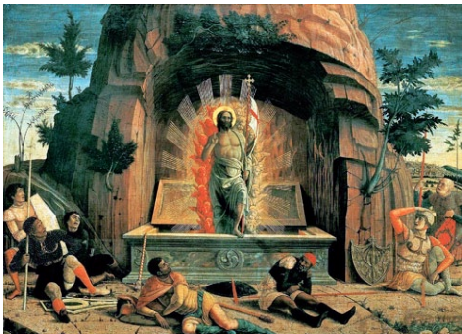
„Zmartwychwstanie” Andrea Mantegna

Zdrowych i spokojnych Świąt Wielkanocnych, głębokiej radości, jaką daje zmartwychwstanie Chrystusa życzą