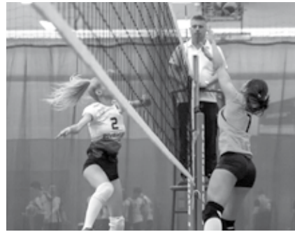
Ligowe rozgrywki wkroczyły w decydującą fazę. O miejsca na podium zespoły powalczą w play-offach

W momencie zamknięcia niniejszego wydania Kuriera, jesteśmy po pięciu kolejkach spotkań. W ostatniej serii meczów FC Silesia pozostała jedynym niepokonanym zespołem po rundzie zasadniczej w lidze damskiej. Drużyna ta straciła tylko trzy sety w ośmiu pojedynkach i zastrzeżenie zajęła pierwsze miejsce w tabeli. W ostatnim pojedynku pokonując 2:1 Zero Siedem. Na drugie miejsce mogły wskoczyć zawodniczki Pivexin Racibórz, ale niespodziewanie przegrały swoje dwa spotkania. Najpierw nie dały rady Diamonds Tychy chociaż w pierwszym secie wygrały do 14, a następnie doznały porażki ze Sportowymi Świrami, które w tym dniu zaprezentowały się najlepiej, bo wygrały aż dwa mecze. Ten drugi z Królowymi Dramatu 2:0. Bardzo ciekawa sytuacja pojawiła się w tabeli na miejscach 6-7. Ze względu na zwycięstwo walkowerem przez Volley Świętochłowice i zdobycie plus 50 punktów ich bilans małych punktów bardzo się polepszył w stosunku do innych zespołów, które mimo wszystko w swoich meczach musiały stracić kilka punktów. O awans do play-off walczyły więc Królowe Dramatu, które musiały stracić jak najmniej punktów z Angels Team. W ostatecznym rozrachunku stosunek małych punktów miały lepszy o 0,02 i awansowały do najlepszej szóstki. W play-offach, w których gramy do dwóch zwycięstw mierzą się następujące pary FC Silesia – Królowe Dramatu, Zero Siedem – Diamonds Tychy oraz Pivexin Racibórz – Sportowe Świry.