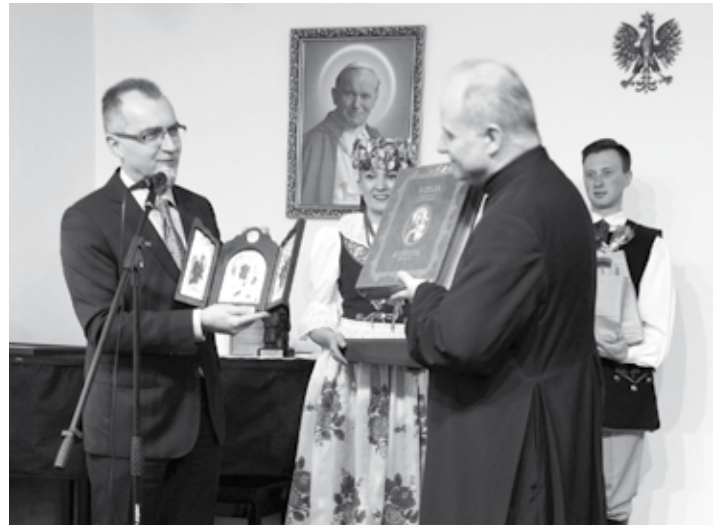
Przekazanie „Biblii Piekarskiej”

11 marca, na zaproszenie Polonii skupionej wokół Domu Polskiego w Budapeszcie, delegacja z Radzionkowa promowała nasze miasto na Węgrzech.