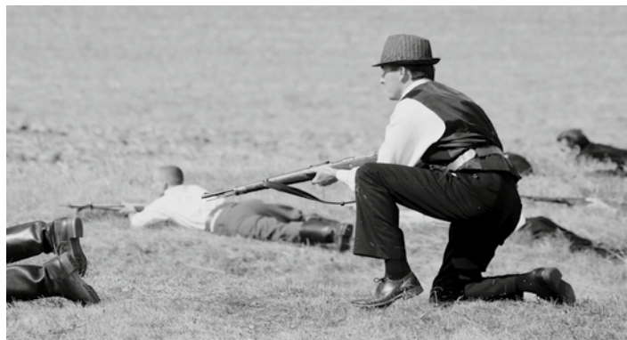
Kategoria „Reportaż lub zdjęcie reporterskie”, I miejsce, autor Damian Stelmach.