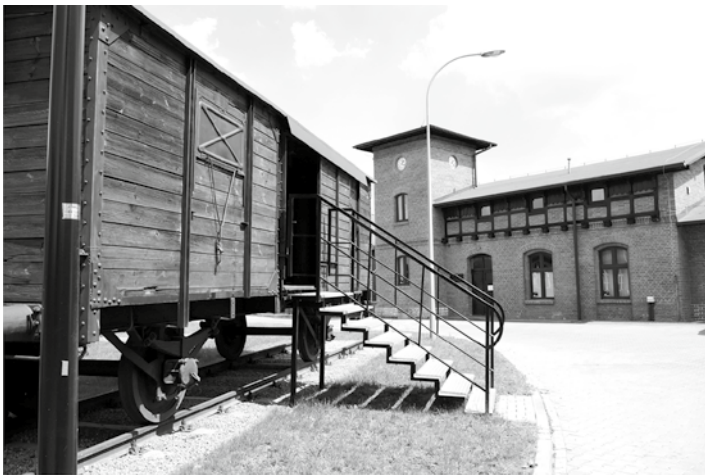
Kategoria „Nasze Miasto”, II miejsce, autor Karolina Szczepaniak.