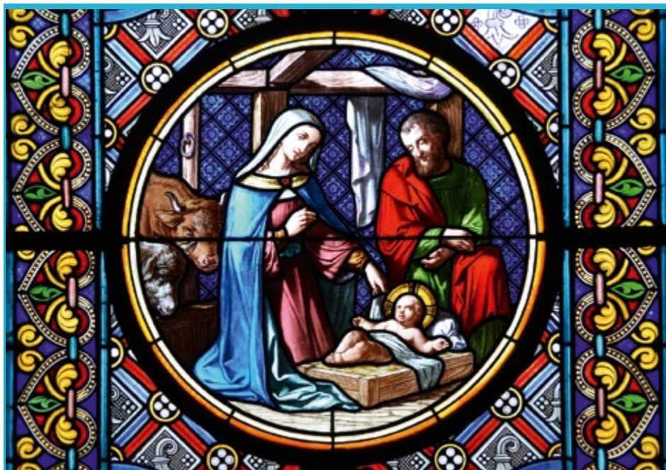
Zabytkowy witraż z późnoromańsko-gotyckiej katedry w Bazylei w Szwajcarii

Z okazji Świąt Bożego Narodzenia życzymy mieszkańcom naszego Miasta, by ten świąteczny czas upłynął w rodzinnej atmosferze, pełnej ciepła i miłości. A także, by nadchodzący Nowy Rok przyniósł wiele sukcesów i radosnych dni