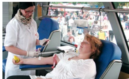
Wakacyjne akcje krwiodawstwa odbyły się w całej Polsce

Aż 82 litry zebrano w Radzionkowie od początku roku, w trakcie trzech akcji honorowego poboru krwi.