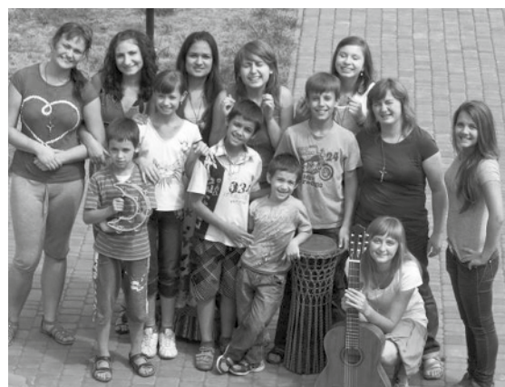
Wolontariuszki z podopiecznymi

Wakacje to nie tylko czas odpoczynku. Przekonała się o tym nasza ośmioosobowa grupa dziewczyn z różnych części Polski, która postanowiła w te wakacje pomóc ludziom na Ukrainie.