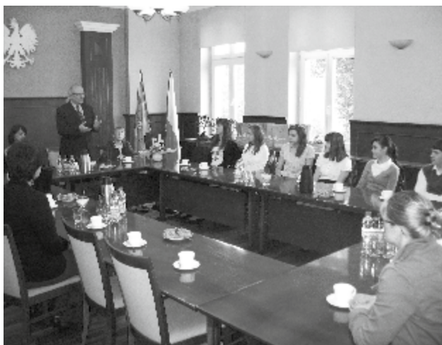
Finał konkursu wraz z wręczeniem nagród, odbył się w Sali Sesyjnej Urzędu Miasta Radzionków

Utworzenie w 2010 roku ogrodu botanicznego na Księżej Górze postawiło Radzionków w jednym szeregu z wieloma miastami na całym świecie, które postawiły na ochronę przyrody. Ochrona zagrożonych wyginieciem poszczególnych gatunków roślin oraz całych ich zbiorowisk jest bowiem jednym z najważniejszych celów funkcjonowania ogrodów botanicznych, również tego w Radzionkowie. Aby radzionkowski ogród również stał się lokalnym centrum ochrony przyrody, nauki, edukacji i rekreacji, potrzeba jeszcze sporo pracy, ale już dziś zauważalny jest jego rozwój – oprócz istniejącego siedliska muraw napiaskowych lada moment w ogrodzie powstanie zastępcze siedlisko dla wilgotnych łąk i torfowisk, które trafią tu z rozbudowywanego lotniska w Pyrzowicach. Ogród otrzyma też środki finansowe na budowę ośrodka edukacji ekologicznej, w ramach którego już od kilku lat odbywają się warsztaty terenowe dla dzieci i młodzieży.