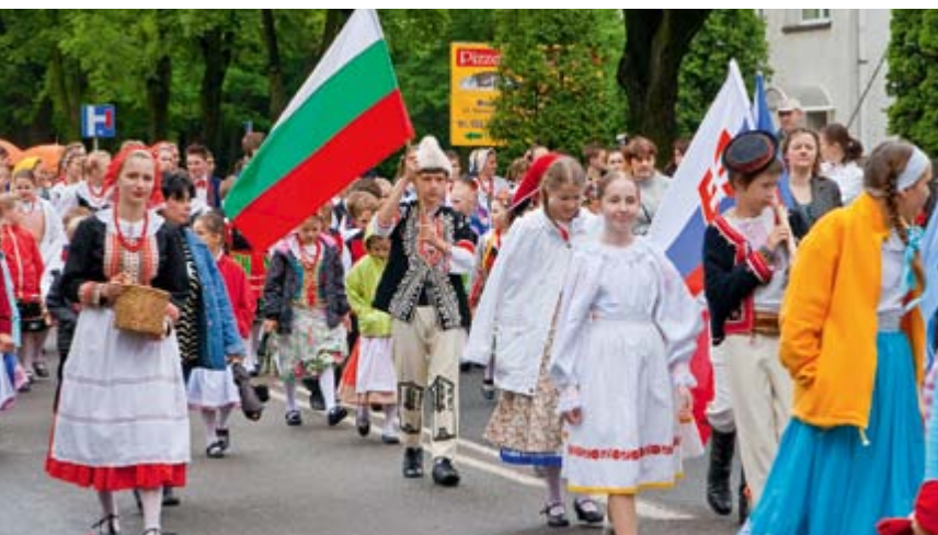
Tradycyjny korowód przeszedł ulicami Radzionkowa

Tegoroczne Dni Radzionkowa rozpoczęły się już 18 maja akcją „Polska Biega” w Parku Księża Góra. W kolejnych dniach mieliśmy mnóstwo atrakcji m.in. koncert zespołu Czysta Jak Ta, turniej judo (współorganizowany przez UKS „Judo Radzionków”), kolejne edycje festynów rodzinnych: „CIDERFEST” (współorganizowany przez parafię św. Wojciecha, Stowarzyszenie Rodzin Katolickich, Ruch Światło-Życie i Młodzieżowy Ruch Apostolski) oraz VIII Integracyjny Festyn Rodzinny (organizowany przez Zespół Szkół Specjalnych), a także tradycyjnie już – koncerty zespołu „Mały Śląsk” z okazji Dnia Matki. Amatorzy strzelania mogli spróbować swoich sił podczas IV Mistrzostw Radzionkowa w Strzelaniu (współorganizowanych przez Stowarzyszenie Żołnierzy Radiotechników RADAR). Miłośnicy gry w karty rywalizowali z kolei w Turnieju Skata (współorganizowanym przez radzionkowski oddział Polskiego Związku Emerytów, Rencistów i Inwalidów), a osoby znające Radzionków „na wylot”, mogły zaprezentować swoją wiedzę w Turnieju Wiedzy o naszym mieście (współorganizowanym przez radzionkowskie koło PTTK).