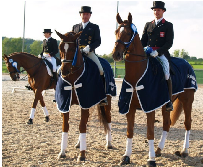
Tegoroczny turniej odbędzie się w dniach 3-6 maja

Szczegółowe informacje na temat zawodów można znaleźć na stronie: www.ham.com.pl/cdi ■